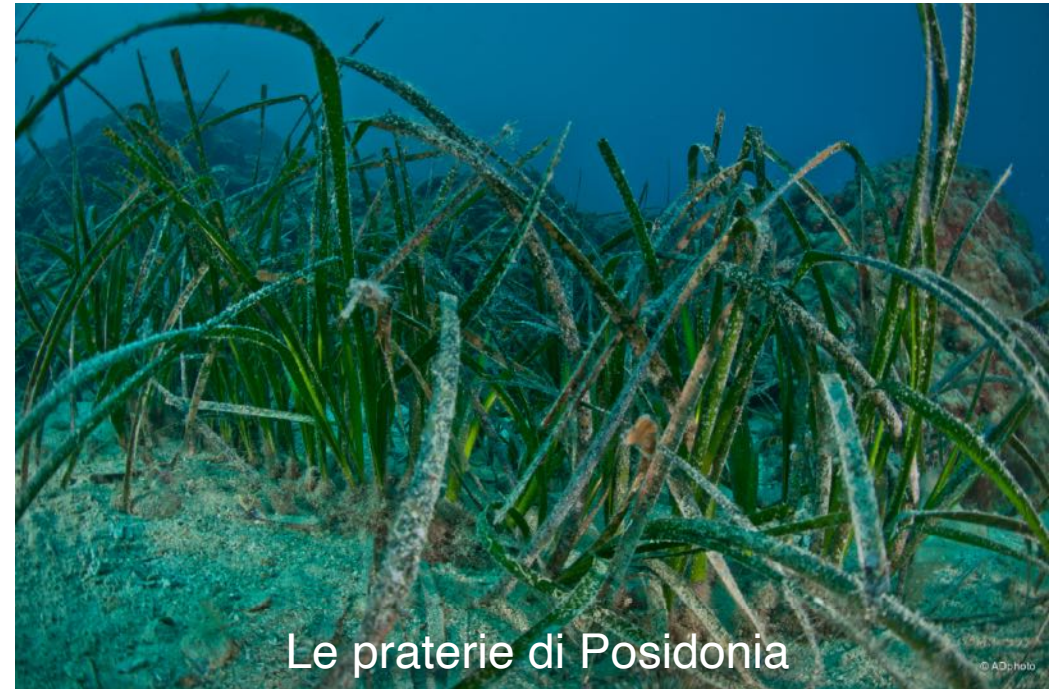
Le praterie di Posidonia

Sostengono la pesca Sostengono la biodiversità Combattono il cambiamento climatico